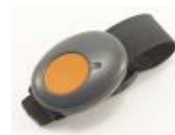
tlačítko na ruku