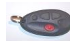
tlačítko na krk