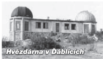
Hvězdárna v Dáblicích

Sraz ve 14:00 hodin na nástupišti stanice metra B – Palmovka.