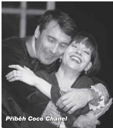
Příběh Coco Chanel

Královna módy, jedna z nejbohatších žen světa, sebevědomá paní kapitalistka s britským až cynickým humorem, nepřestala být nikdy nešťastnou naivní švadlenkou, toužící mít to, co většina žen: manžela a dítě. Celoživotní slečna však měla „štěstí v kartách a smůlu v lásce“.